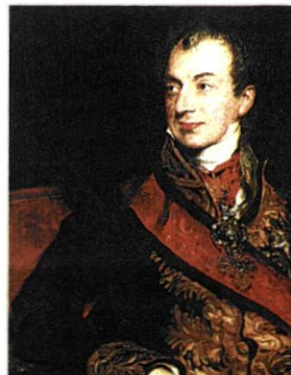
Ο Αυστριακός καγκελάριος, πρίγκιπας Μέτερνικ (Klemens von Metternich, 1773-1859).

Ο Μέτερνικ, ο Κάσλρι και ο Ταλεϋράνδος επιδίωκαν να δημιουργήσουν τις προϋποθέσεις για τη διατήρηση μόνιμης ισορροπίας ισχύος στην Ευρώπη, για την αποφυγή της κυριαρχίας μιας μεγάλης δύναμης, όπως αυτή της Γαλλίας του Ναπολέοντα. Για να προληφθεί νέα διατάραξη της ευρωπαϊκής ασφάλειας από την πλευρά της Γαλλίας, δημιουργήθηκε «ανάχωμα» ισχυρών κρατών στα ανατολικά της: το Βασίλειο της Ολλανδίας, στο οποίο προστέθηκε και το Βέλγιο, παλαιά κτήση της Αυστρίας, και το Βασίλειο της Σαρδηνίας, στο οποίο προσαρτήθηκαν το Πεδεμόντιο και η Γένοβα. Ανακηρύχθηκε επίσης η ουδετερότητα της Ελβετίας. Η Πρωσία προσάρτησε όλα σχεδόν τα γερμανικά εδάφη στα ανατολικά του ποταμού Ρήνου, και έγινε ένα είδος γέφυρας που ένωνε τη Δυτική με την Ανατολική Ευρώπη και χώριζε τη Ρωσία από τη Γαλλία. Η Αυστρία ενίσχυσε τη θέση της έναντι της Γαλλίας με την ανάκτηση της Τοσκάνης και του Μιλάνου και με την προσάρτηση της Βενετίας. Θύματα των ρυθμίσεων αυτών υπήρξαν οι ιταλικές και οι μικρές γερμανικές χώρες. Η Ιταλία και η Γερμανία παρέμειναν, για μισό αιώνα ακόμη, ιστορικές και γεωγραφικές έννοιες, κατακερματισμένες σε μικρά βασίλεια, πριγκιπάτα και δουκάτα, υπό την επιρροή της Αυστρίας και της Πρωσίας αντίστοιχα.