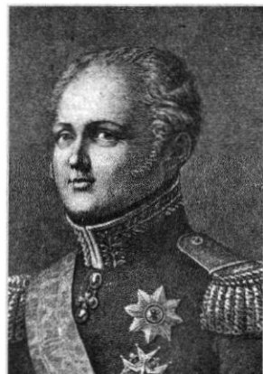
Ο τσάρος Αλέξανδρος Α΄. Γεννάδειος Βιβλιοθήκη, Αθήνα.

«Ο τσάρος Αλέξανδρος Α΄ της Ρωσίας είχε ενθουσιαστεί με την ιδέα μιας χριστιανικής ένωσης της Ευρώπης και είχε πετύχει να πείσει, μετά το 1815, τους ηγεμόνες της Πρωσίας και της Αυστρίας, καθώς και τα περισσότερα κράτη να προσχωρήσουν σε μια "Ιερά Συμμαχία". Αυτή βασιζόταν "στην εμπιστοσύνη και την ελπίδα τους στη Θεία Πρόνοια" και στην πεποίθηση ότι ήταν αναγκαίο η πορεία που θα υιοθετούσαν οι δυνάμεις να βασίζεται, κατά τις αμοιβαίες τους σχέσεις, στις υπέρτιτες αλήθειες που τους διδάσκει η ανώνια θρησκεία του Θεού σωτήρα».