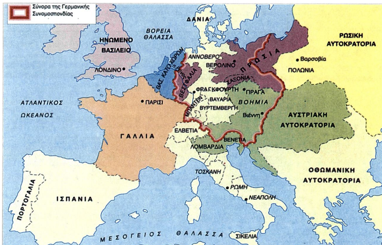
Ο χάρτης της Ευρώπης κατά το 1815, όπως διαμορφώθηκε με βάση τις αποφάσεις του Συνεδρίου της Βιέννης.

Η παλινόρθωση* του «παλαιού καθεστώτος». Τα εδαφικά και τα πολιτικά ζητήματα στην Ευρώπη τα χειρίστηκαν (αφού έγινε δεκτή στο συνέδριο και η ηττημένη Γαλλία) τρεις κυρίως άνδρες, ο υπουργός Εξωτερικών της Βρετανίας κόμης Κάσλρι, ο καγκελάριος της Αυστρίας πρίγκιπας Μέτερνιχ , ο οποίος και προήδρευσε του συνεδρίου, και ο υπουργός Εξωτερικών της