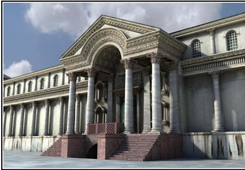
Το Ιερό Παλάτι