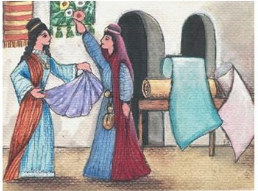
3. Οι γυναίκες στο Βυζάντιο διακρίνονταν στο εμπόριο των υφασμάτων.

Παρά τα εμπόδια των νόμων και των παραδόσεων, που όριζαν ότι «δεν επιτρέπεται στις γυναίκες να καθίζουν στο εργαστήριο, να πωλούν και να αγοράζουν» , πολλές γυναίκες σταδιοδρόμησαν σε επαγγέλματα της αγοράς και ιδιαίτερα σε όσα είχαν σχέση με τα υφάσματα. Οι βυζαντινές πηγές μιλούν ακόμη για γυναίκες ιατρούς, μαιές, «δασκάλες κόμμωσης και ραπτικής», αλλά και ιδιοκτήτριες καταστημάτων τροφίμων.