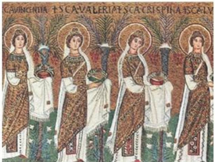
1. Γυναίκες σε θρησκευτική πομπή την εποχή του Ιουστινιανού (ψηφιδωτή τοιχογραφία, Άγιος Απολλινάριος, Ραβέννα).