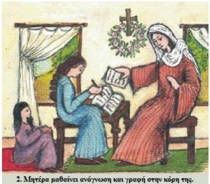
2. Μητέρα μαθαίνει ανάγνωση και γραφή στην κόρη της.