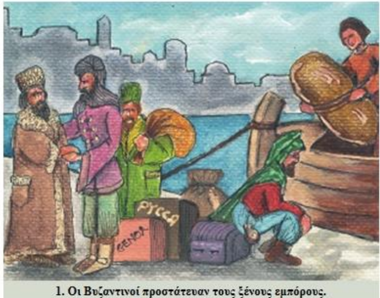
1. Οι Βυζαντινοί προστάτευαν τους ξένους εμπόρους.

Η προστασία των ξένων εμπόρων και επισκεπτών