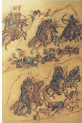
2. Η διπλωματία «των ξένων όπλων»: Το ιππικό των Ρώσων κυνηγά τους Βουλγάρους. Η εικόνα αναφέρεται στην περίοδο που οι Ρώσοι συνεργάστηκαν με τους Βυζαντινούς εναντίον των Βουλγάρων (δες κεφάλαιο 22) (Μικρογραφία από βουλγαρικό χειρόγραφο, Βιβλιοθήκη Βατικανού).