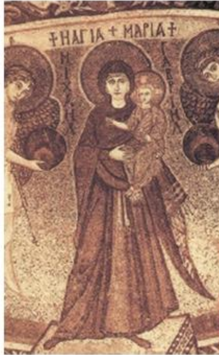
3. Ψηφιδωτή εικόνα, από την Παναγία την Αγγελόκτιστη, στο Κίτιο της Κύπρου

Ιστορία του Ελληνικού Έθνους (Εκδοτική Αθηνών)