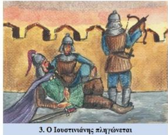
3. Ο Ιουστινιάνης πληγώνεται

Στην κρίσιμη ώρα ανοίγουν οι κρυφές καταπακτές των δεξαμενών και πλημμυρίζουν με νερό την τάφρο και τα λαγούμια. Χιλιάδες επιπθέμενοι παγιδεύονται εκεί κι αφανίζονται. Μα κι αυτούς που σκαρφαλώνουν με γάντζους και ανεμόσκαλες στα τείχη τούς περιμένουν οι υπερασπιστές. Το μέτωπο της επίθεσης κλονίζεται. Κανείς όμως δεν γυρίζει πίσω.