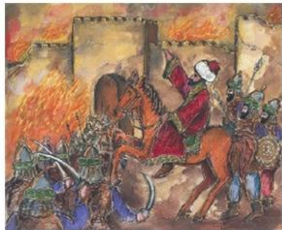
2. Ο Μωάμεθ έξω από την Κωνσταντινούπολη.