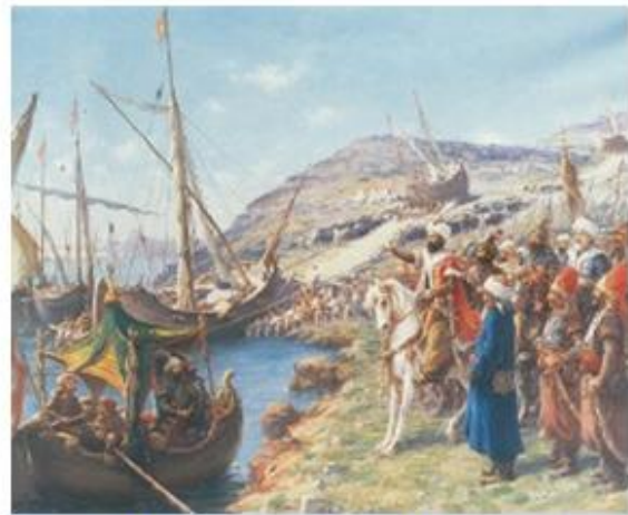
1. Ο Μωάμεθ παρακολουθεί το πέρασμα των караβιών στον Κεράτιο από τη στεριά. (Πίνακας του Φαούστο Ζονάρο, Κωνσταντινούπολη, Παλάτι Ντολμαμπαγτσέ, 1908).

Ο διάλογος αυτός ήταν και ο τελευταίος ανάμεσα στους δυο ανηπάλους. Ο κλοιός των πολιορκητών στένεψε. «Ούτε πουλί πετούμενο δε μπορούσε πια να μπει στην Πόλη» . Ξημερώματα της 29ης Μαΐου, ημέρα Τρίτη, άρχισε η μεγάλη επίθεση. Τις ομοβροντίες των κανονιών σκεπάζει ο αχός του πιο μεγάλου από αυτά, της μπομπάρδας, που χτυπά και ραγίζει τον πύργο του Αγίου Ρωμανού. Χιλιάδες πολιορκητές ορμούν στα τείχη, στα λαγούμια και στη βαθιά τάφρο, αφηφώ-