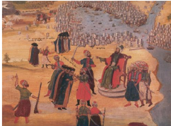
2. Η πολιορκία της Κωνσταντινουπόλης (Σκέψις Μακρυγιάννη, πίνακας Π. Ζωγράφου, 1836)

Ο νέος σουλτάνος Μωάμεθ Β΄ παρά το ότι διαβεβαίωσε τη βυζαντινή πρεσβεία ότι θα σεβαστεί τις συνθήκες που ο πατέρας του είχε κάνει με τον Κωνσταντίνο Παλαιολόγο, είχε σαν στόχο να ολοκληρώσει την επιθυμία του πατέρα του και να καταλάβει την Κωνσταντινούπολη. Αφού συγκέντρωσε στόλο και στρατό, τον Μάρτιο του 1453 ξεκίνησε η πολιορκία της Πόλης. Ο ίδιος ο Μωάμεθ έστησε τη σκηνή-στρατηγείο του απέναντι από την πύλη του Αγίου Ρωμανού, ανάμεσα σε χιλιάδες γενίτσαρους και ήταν έτοιμος για επίθεση.