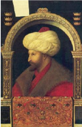
1. Ο Μωάμεθ Β΄