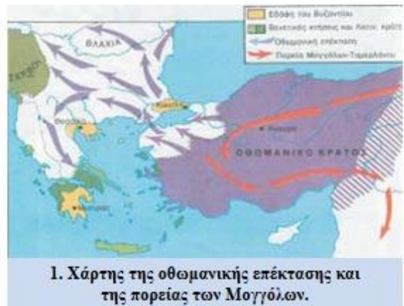
1. Χάρτης της οθωμανικής επέκτασης και της πορείας των Μογγόλων.

Για είκοσι χρόνια οι Τούρκοι δεν ενόχλησαν ξανά το Βυζάντιο. Το 1421 όμως έγινε σουλτάνος ο Μουράτ Β' . Φιλόδοξος και ορμητικός καθώς ήταν, ήθελε να συνεχίσει το έργο που δεν ολοκλήρωσε ο Βαγιαζήτ. Γι' αυτό οργάνωσε το στρατό του και τον επόμενο