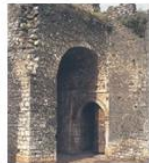
3.α. Τμήμα του κάστρου των Ιωαννίνων, όπως είναι σήμερα.