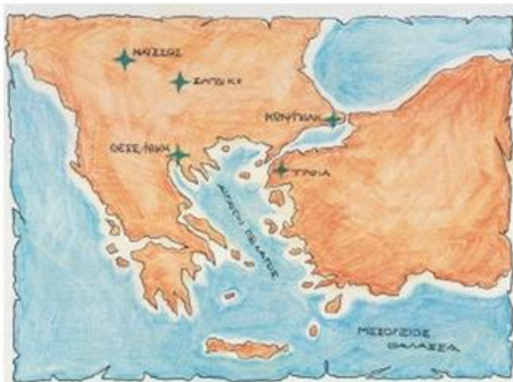
1. Χάρτης με τις πόλεις που ο Κωνσταντίνος είχε διαλέξει για να μεταφέρει την πρωτεύουσα της Ρωμαϊκής Αυτοκρατορίας.

Είχε ακόμη αξιόλογη πνευματική ανάπτυξη και δραστηριότητα, όπως μαρτυρούν τα μνημεία παλαιάς βυζαντινής τέχνης και οι εκκλησίες που σώζονται ακόμη στην πόλη. Ξεχωριστή θέση ανάμεσά τους είχε ο ναός του Αγίου Δημητρίου, που ήταν πολιούχος και προστάτης της.