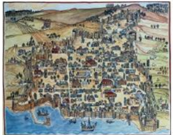
2. Ο ναός του Αγίου Δημητρίου στη Θεσσαλονίκη