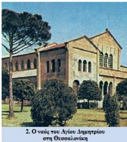
2. Ο ναός του Αγίου Δημητρίου στη Θεσσαλονίκη