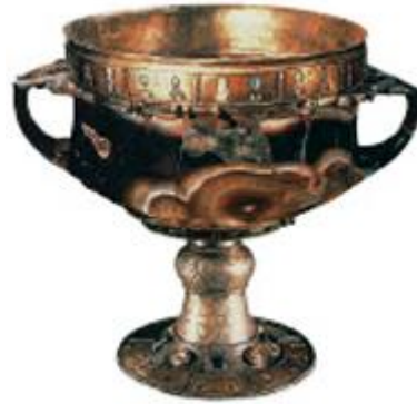
Πολύτιμο δισκοπότηρο από την Αγία Σοφία. Μεταφέρθηκε στη Βενετία.

9. Τα έργα τέχνης λεηλατήθηκαν ή μεταφέρθηκαν στη Δύση.