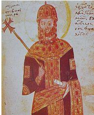
Μιχαήλ Η' Παλαιολόγος

3. Με μυστική εντολή δικοί του άνθρωποι παρακολουθούσαν μέρα-νύχτα την Πόλη αναζητώντας τρόπο να μπουν σ' αυτή κρυφά .