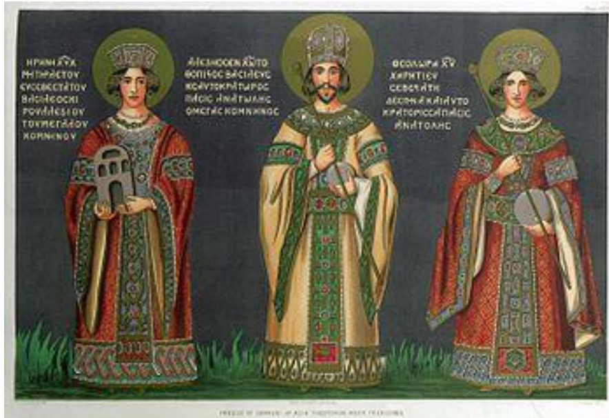
Ο Αλέξιος Γ', αριστερά η μητέρα του Ειρήνη Παλαιολογίνα και δεξιά η σύζυγός του Θεοδώρα Καντακουζηνή. Αντίγραφο τοιχογραφίας από την εκκλησία της Αγίας Θεοτόκου της Τραπεζούντας του 19ου αιώνα.