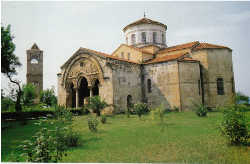
Αγία Σοφία Τραπεζούντας

3. Γίνεται το χριστιανικό κέντρο της περιοχής και η βάση του ποντιακού ελληνισμού.