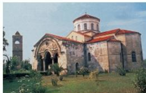
3. Ο ναός της Αγίας Σοφίας στην Τραπεζούντα. Οι ιδρυτές του νέου κρατιδίου μετέφεραν εδώ τις μνημές και το όνομα της Μεγάλης Εκκλησίας.