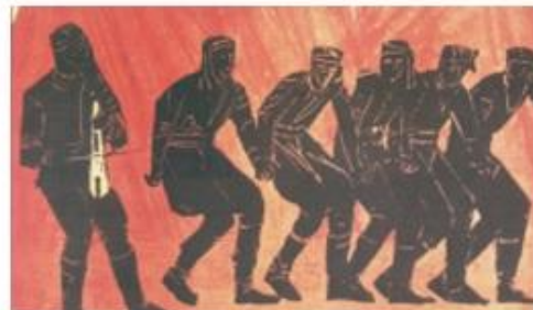
2. Πόντιοι χορευτές και λυράρης

Η Τραπεζούντα χριστιανικό κέντρο του Εύξεινου Πόντου