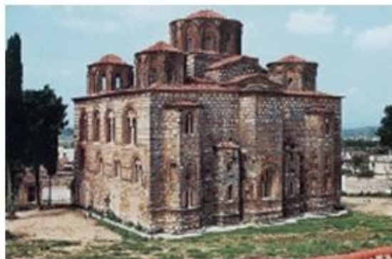
4. Στην Παναγία την Παρηγορίτισσα αφιέρωσαν τη Μητρόπολή τους, στην Άρτα, οι ιδρυτές του Δεσποτάτου της Ηπείρου.

Το ίδρυσε στην Ήπειρο ο δεσπότης Μιχαήλ Α' Άγγελος με πρωτεύουσά του την Άρτα . Με τον καιρό αύξησε την επικράτειά του σε όλη τη δυτική Ελλάδα και τη Μακεδονία. Η πιο σημαντική στιγμή της ιστορίας του όμως ήταν η απελευθέρωση της Θεσσαλονίκης, της δεύτερης σημαντικής πόλης της Αυτοκρατορίας, από τους Λατίνους, είκοσι χρόνια μετά την άλωσή της (1224).