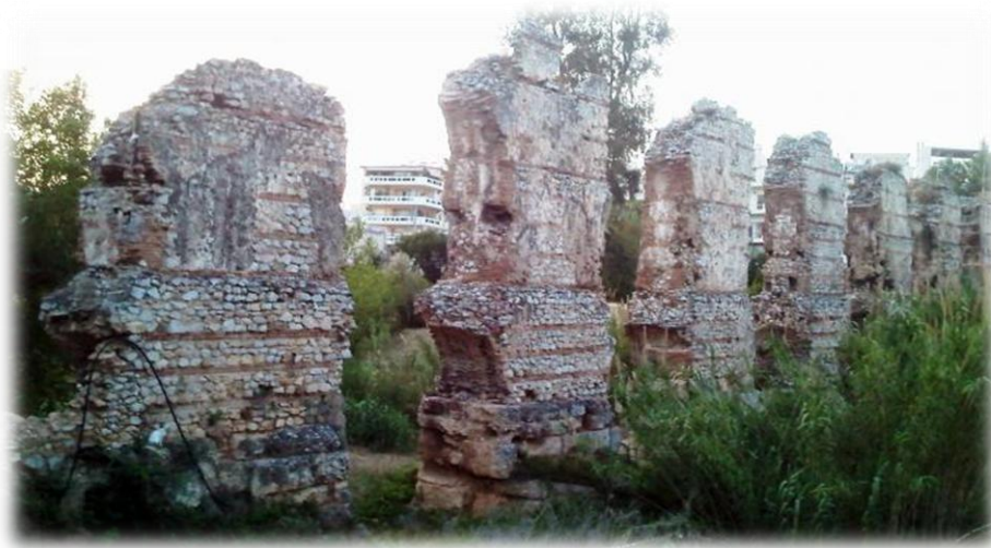
Ερείπια του Αδριάνειου Υδραγωγείου.

Ένα ιδιαίτερα σημαντικό και διαχρονικό έργο, που ωφέλησε τους Αθηναίους ήταν το Αδριάνειο υδραγωγείο που κατασκευάστηκε με στόχο την ύδρευση της πόλης των Αθηνών. Μια σήραγγα μήκους 25 χιλιομέτρων ξεκινούσε από την περιοχή του Τατοΐου και μετέφερε το νερό έως και τους πρόποδες του Λυκαβηττού. Ερείπια του Αδριάνειου Υδραγωγείου θα δεις σήμερα στη Νέα Ιωνία.