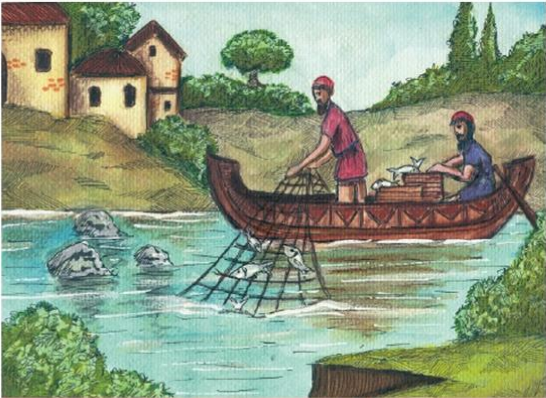
2. Στους Βυζαντινούς άρρασε ιδιαίτερα το ψάρεμα.

Πολλές όμως εργάζονταν στο σπίτι υφαίνοντας και κεντώντας και άλλες σε εργαστήρια και καταστήματα αρωμάτων και μεταξιού.