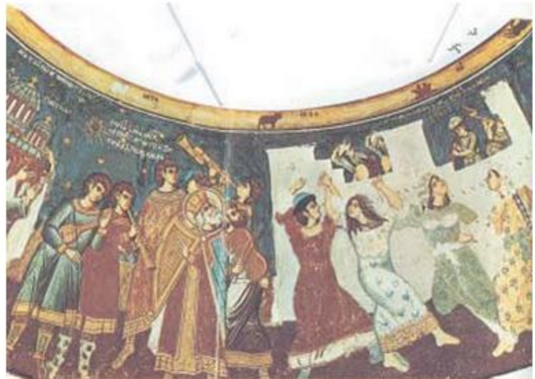
1. Ο αυτοκράτορας Μιχαήλ Γ' ανάμεσα σε δασκάλους και φοιτητές του Πανεπιστημίου (Μικρογραφία, Ρώμη, Βατικανή Βιβλιοθήκη).

Τα καθήκοντα και οι ασχολίες των γυναικών