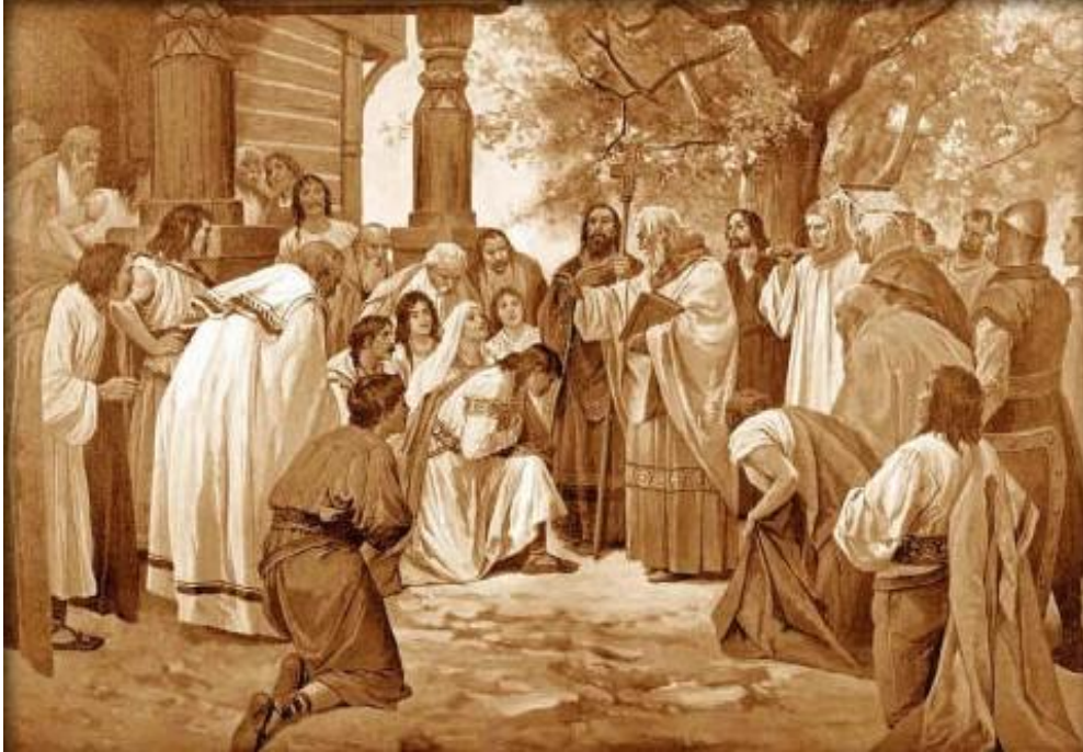
Οι Άγιοι Κύριλλος και Μεθόδιος διδάσκουν το χριστιανισμό στους σλαβόφωνους πληθυσμούς.