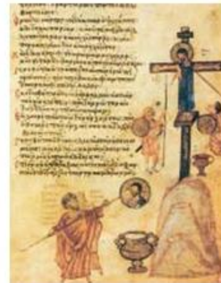
1. Εικονομάχοι παριστάνονται σαν σταυρωτές του Ιησού, σε μικρογραφία χειρογράφου (Ιστορικό Μουσείο Μόσχας).

Και οι δυο πλευρές ήταν ανυποχώρητες και υποστήριζαν με φαναισμό τις απόψεις τους.