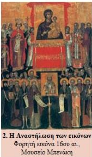
2. Η Αναστήλωση των εικόνων. Φορητή εικόνα 16ου αι., Μουσείο Μπενάκη

Ο διχασμός αυτός κράτησε έναν περίπου αιώνα και είχε δυσάρεστες συνέπειες για όλους. Στη διάρκειά του πολλοί άνθρωποι έχασαν τη ζωή τους και άλλοι φυλακίστηκαν ή εξορίστηκαν. Ναοί και μοναστήρια έκλεισαν και πολλές εικόνες, ψηφιδωτά και έργα τέχνης καταστράφηκαν. Διαταράχτηκαν ακόμη οι σχέσεις ανάμεσα στο Βυζάντιο και τη Δυτική εκκλησία, η οποία τάχτηκε με το μέρος των εικονολατρών.