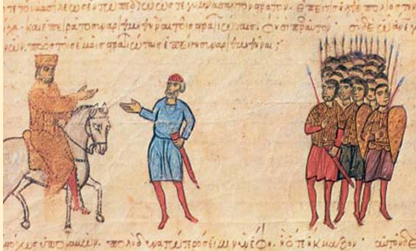
5.α. Ο αυτοκράτορας επιλύει διαφορές ανάμεσα σε στρατιωτικούς (Βυζαντινή μικρογραφία, Μαδρίτη, Εθνική Βιβλιοθήκη)

Το παραπάνω παράθεμα αποτελεί απόσπασμα της «Εκλογής». Ο Λέων Γ' θεωρούσε τη δικαιοσύνη το σημαντικότερο αγαθό προκειμένου να προοδεύσει το κράτος. Αν όλοι οι κάτοικοι της αυτοκρατορίας ένιωθαν ασφαλείς, τότε θα επικρατούσε ειρήνη, ηρεμία και ασφάλεια στο εσωτερικό και ο αυτοκράτορας θα μπορούσε να φροντίσει για την αντιμετώπιση των εξωτερικών κινδύνων. Μάλιστα, παρατηρώντας την εικόνα, βλέπουμε πως ο ίδιος ο αυτοκράτορας πέρα από τους δικαστές που είχε ορίσει για να την καλύτερη απονομή της δικαιοσύνης, φρόντιζε και ο ίδιος να επιλύει διαφορές ανάμεσα στους κατοίκους προκειμένου κανείς να μη νιώθει αδικημένος.