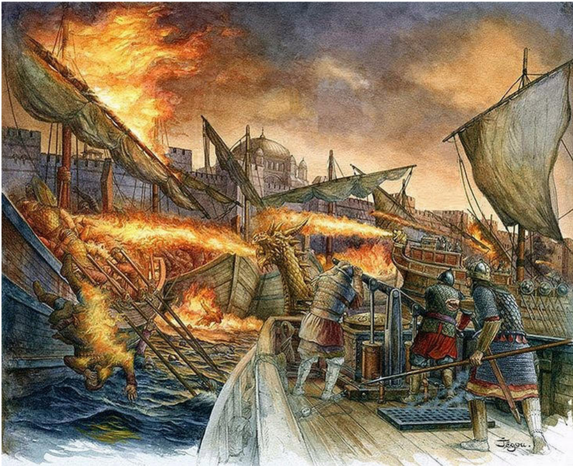
Οι Άραβες πολιορκούν την Κωνσταντινούπολη