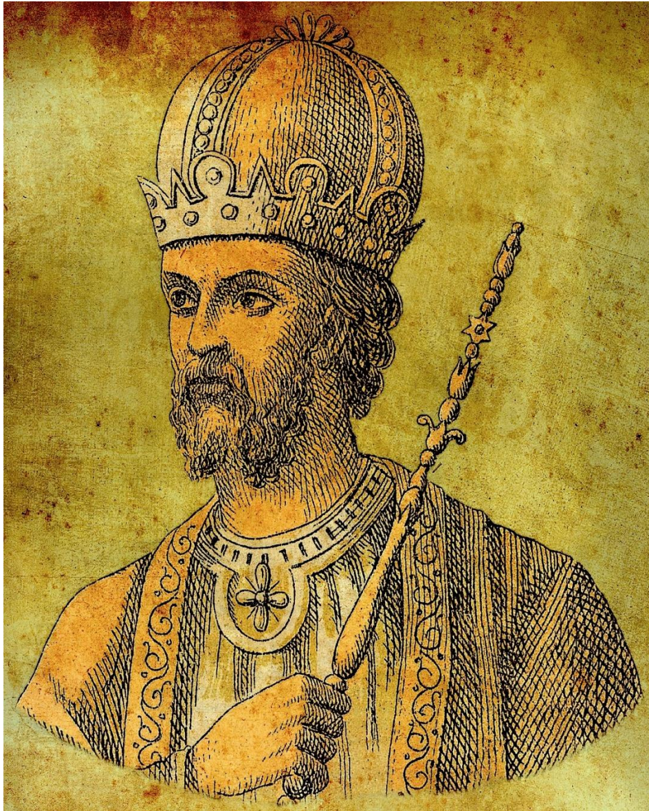
Λέων Γ΄ ο Ίσαυρος

6. Ο αυτοκράτορας Λέων ο Γ΄ ο Ίσαυρος , έκανε τολμηρές αλλαγές στη νομοθεσία και τη διοίκηση του κράτους για να αντιμετωπίσει τα προβλήματα.