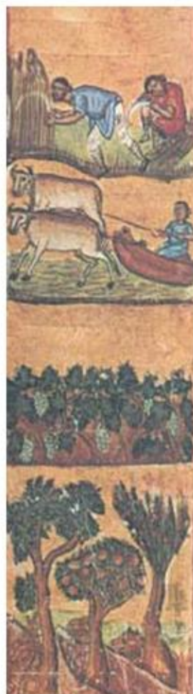
1. Εικόνες από τη γεωργική ζωή των Βυζαντινών. Μονή Εσφιγμένου, Άγιο Όρος)