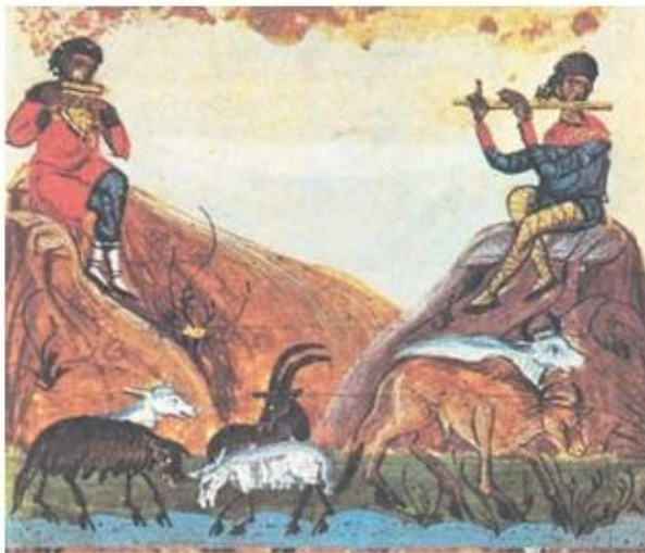
4. Κτηνοτρόφοι βόσκουν το κοπάδι τους (βυζαντινή μικρογραφία)

β. «Εάν οπωροφύλακας συλληφθεί να κλέπτει και να πωλεί φρούτα από τα κτήματα που έχει οριστεί να φυλάσσει, να δαρθεί σκληρά και να στερηθεί το μισθό του».