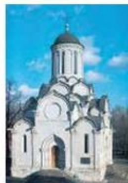
4. Ρωσική εκκλησία (Μόσχα, Μονή Ανδρονίκου, 1400 περίπου).

Στα χρόνια που αυτοκράτορας ήταν ο Βασίλειος Β', και μετά, οι Ρώσοι εκχριστιανίστηκαν από τους Βυζαντινούς. Ο εκχριστιανισμός βοήθησε να αποκτήσουν οι ίδιοι και το Βυζάντιο μεγάλη πολιτική, οικονομική και πνευματική ακτινοβολία. Ανάμεσα στα δύο κράτη αναπτύχθηκαν στενοί θρησκευτικοί και πολιτικοί δεσμοί. Οι Ρώσοι γνώρισαν το βυζαντινό πολιτισμό και προόδευσαν, ενώ οι Βυζαντινοί εξασφάλισαν ειρήνη και συνεργασία μαζί τους. Οι φιλικοί αυτοί δεσμοί διατηρήθηκαν επί πολλούς αιώνες.