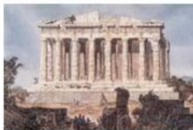
3.α. Ο Παρθενώνας στα βυζαντινά χρόνια λειτουργήσε ως ναός της Παναγίας της Αθηνιώτισσας. (χάλκογραφία του 1843).

Γεώργιος Κεδρηνός, Σύντομες Ιστοριές (11ος αιών.)