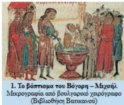
1. Το βάπτισμα του Βόγορη – Μιχαήλ. Μικρογραφία από βουλγαρικό χειρόγραφο (Βιβλιοθήκη Βατικανού)

Λίγα χρόνια αργότερα οι Βούλγαροι, με αρχηγό το Σαμουήλ , επιτέθηκαν ξανά κι έκαναν φοβερές καταστροφές στις ελληνικές περιοχές, φτάνοντας ως την Πελοπόννησο. Ακολούθησαν σκληρές και μακροχρόνιες συγκρούσεις ανάμεσα στους δυο στρατούς. Ο βυζαντινός στρατηγός Νικηφόρος Ουρανό ς τούς αντιμετώπισε νικηφόρα στο Σπερχειό ποταμό και ο αυτοκράτορας Βασίλειος ο Β' συνέτριψε το στρατό τους στα στενά του Κλειδιού της Μακεδονίας, πλάι στον ποταμό Στρυμόνα (1014).