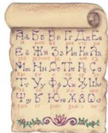
1. Σλαβικό αλφάβητο.