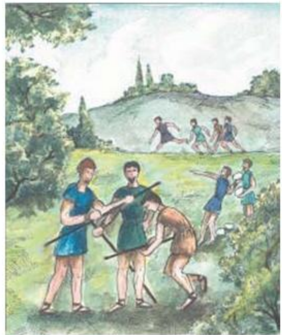
1. Οι Ακρίτες γυμνάζονταν για να είναι πάντα ετοιμοπόλεμοι.

Ο πιο ξακουστός από τους ακρίτες ήταν ο Βασίλειος Διγενής , που στο πρόσωπό του συγκέντρωνε τα χαρίσματα όλων των ακριτών και εξυμνήθηκε ξέχωρα στο έπος 3 «Βασίλειος Διγενής Ακρίτας». Στην Κύπρο, στον Πόντο, στην Κρήτη και σ' όλη την Ελλάδα μιλούν και τραγουδούν, ακόμη και σήμερα, για «της γης τον ανδρειωμένο», που είναι απόγονος του Ηρακλή, του Αχιλλέα και του Μεγαλέξανδρου, αλλά και πρόγονος του κλέφτη του 1821.