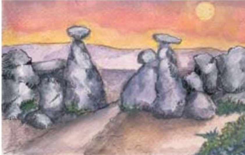
Οι «Πύλες της Κιλικίας». Στενό πέρασμα στη Μικρά Ασία.

4. Έκλειναν τους δρόμους της θάλασσας και της στεριάς και έτσι δυσκόλευαν τον ανεφοδιασμό της πρωτεύουσας με σιτάρι και πρώτες ύλες.