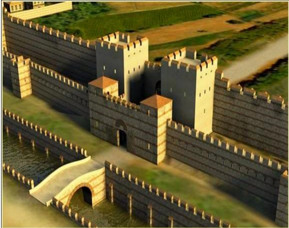
Τα Θεοδοσιανά τείχη ή «θεοφύλακτα»

6. Οι Βυζαντινοί κατάφεραν να τους αντιμετωπίσουν χάρη στην πολύ καλή οχύρωση της Πόλης.