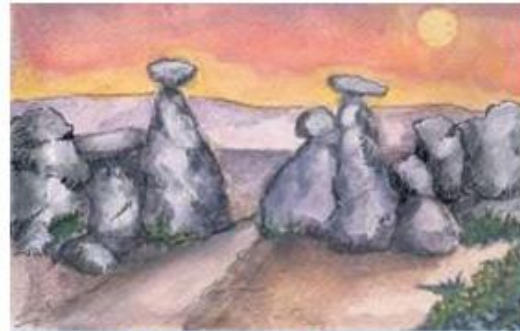
1. Οι «Πύλες της Κιλικίας». Στενό πέρασμα στη Μικρά Ασία.

Γύρω από τα σύνορα του Βυζαντίου υπήρχαν πολλοί λαοί. Κάποιοι ζούσαν εκεί από παλιότερα χρόνια και άλλοι εμφανίζονταν για πρώτη φορά, κατά τις μετακινήσεις τους. Οι Βυζαντινοί επικοινωνούσαν μαζί τους και προσπαθούσαν να διατηρούν καλές σχέσεις. Αυτοί όμως συχνά δημιουργούσαν προβλήματα στην αυτοκρατορία. Έκαναν επιδρομές, λεηλατούσαν και κατέστρεφαν τις καλλιέργειες, καταλάμβαναν τις ακρινές επαρχίες της αυτοκρατορίας και αιχμαλώτιζαν τους κατοίκους τους. Έκλειναν ακόμη τα στενά περάσματα των δρόμων της στεριάς και της θάλασσας και δυσκόλευαν τον ανεφοδιασμό της πρωτεύουσας με σιτάρι, πρώτες ύλες και άλλα αγαθά.