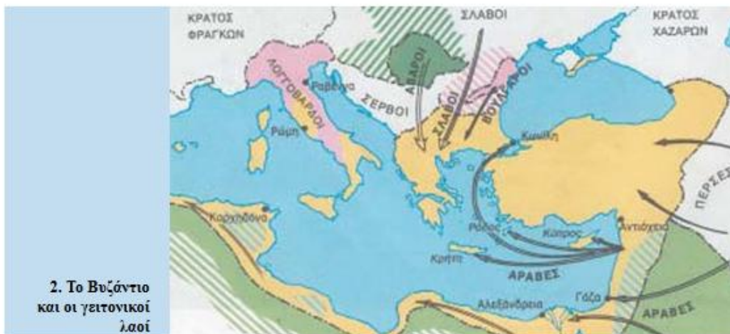
2. Το Βυζάντιο και οι γειτονικοί λαοί