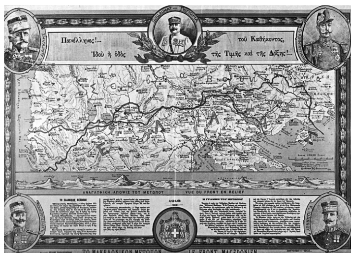
Χάρτης που απεικονίζει το στρατιωτικό μέτωπο στη Μακεδονία κατά τον Α΄ Παγκόσμιο Πόλεμο, Αθήνα, Μουσείο «Ιστορική Μνήμη Ελευθερίου Βενιζέλου»

Χάρης Τσιρκινίδης, Επιπέλους τους ξεριζώσαμε... Η γενοκτονία των Ελλήνων του Πόντου, της Θράκης και της Μ. Ασίας μέσα από τα γαλλικά αρχεία, Θεσσαλονίκη 1999, σ. 121.