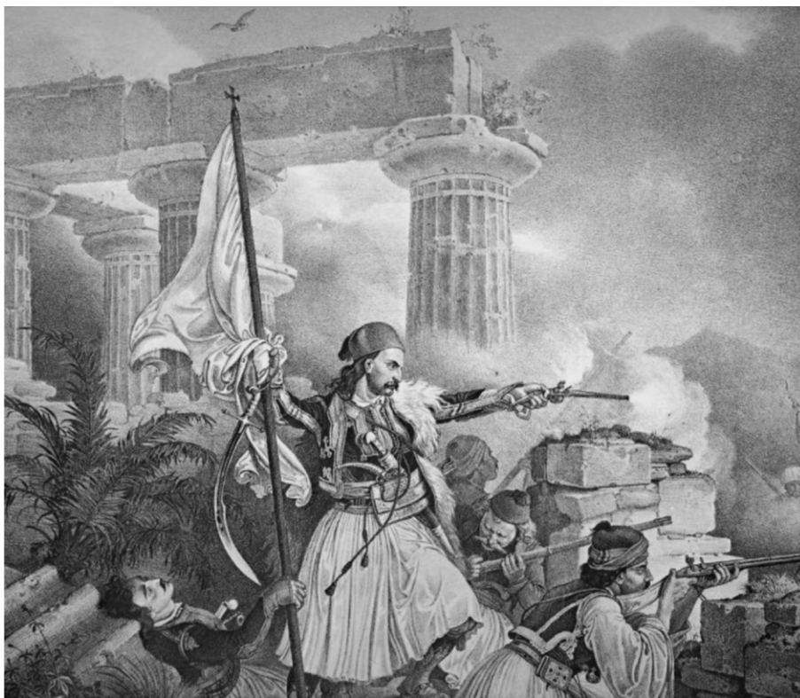
Καπετάνιος μαχόμενος με τα παλικάρια του

Εικόνα 1. Ο Οδυσσέας Ανδρούτσος υπήρξε ένας από τους επιφανέστερους ήρωες της Επανάστασης. Σκοτώθηκε το 1825. Με τη νίκη του στο χάνι της Γραβιάς συνέβαλε αποφασιστικά στην εδραίωση της Επανάστασης στη Στερεά Ελλάδα.