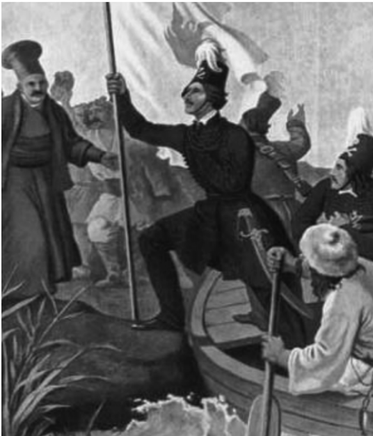
Ο Αλέξανδρος Υψηλάντης αποβιβάζεται στο Ιάσιο στις 22 Φεβρουαρίου 1821

Την 24ην Φεβρουαρίου 1821, Εις το γενικόν στρατόπεδον του Ιασίου».